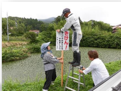
人手がいる作業です