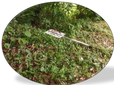
作業前はこんな状態

作業当日は非常に蒸し暑い日で、広範囲にわたる危険個所での作業は大変でしたが、部会員は二班に分かれて効率よく作業を進めていき、事故やケガもなく12：00に作業完了しました。