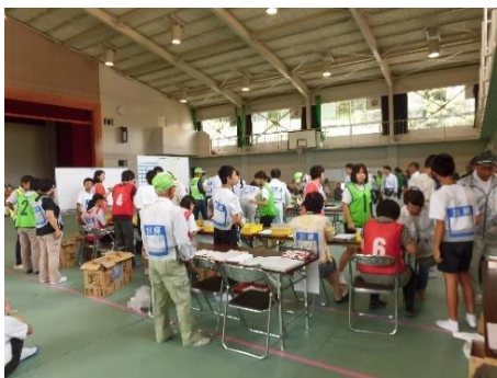
《避難所受付の様子》

この日のために何度も打ち合わせを重ね、避難所運営をスムーズに行ってくださった内日中学校・内日小学校の先生方・自治会の皆様、ありがとうございました。内日中学校の生徒の皆さんも、手際よく受付対応をしてくれて大変頼もしい存在でした。