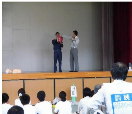
《消防署職員のAED講習》