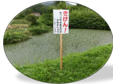
きれいに整備されました