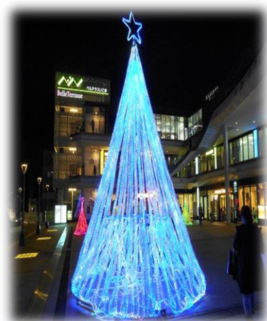
【ペットボトルツリーイメージ】

作成にあたり、 ペットボトル500本が必要ですので 、 皆さまのご協力をお願いいたします。 収集方法等詳細は、自治会の回覧で、ご案内していきます。